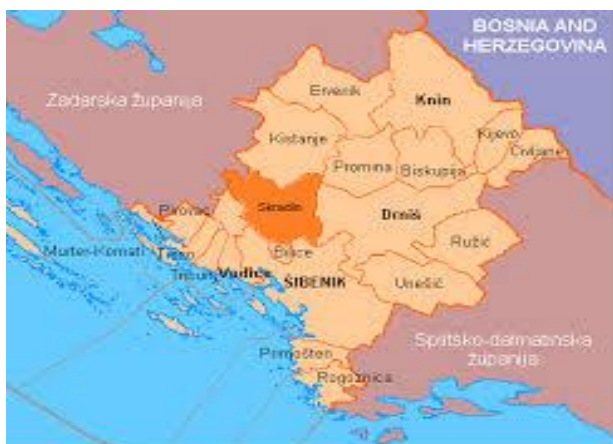
Slika 2. Osnovni podaci o Gradu- Geografski položaj Skradina u Šibensko-kninskoj županije